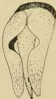
Abb. 3: Andrena torda n. sp.: Genitalkapsel.

Skulptur: Clypeus abweichend, stark netzig chagriniert, leicht gerunzelt mit schräg eingestochenen Punkten. Mesonotum statt netzig chagriniert und dicht punktiert, schwach chagriniert und schwach glänzend, deutlich zerstreuter punktiert, Abstand